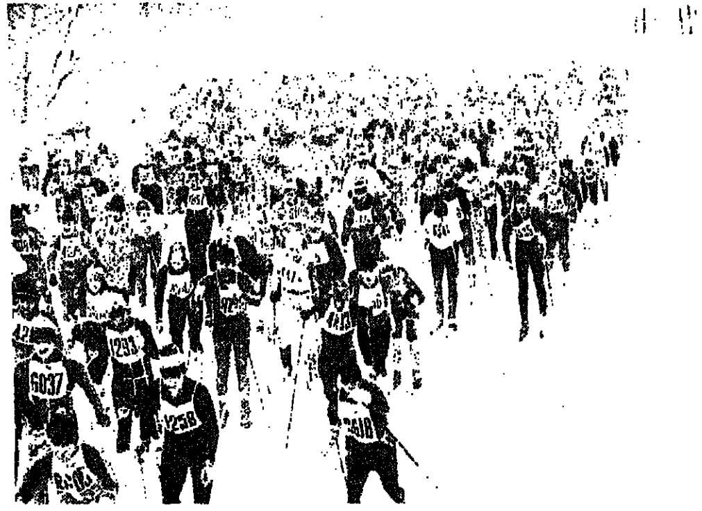
سباق التزلج بالسكي في موسكو